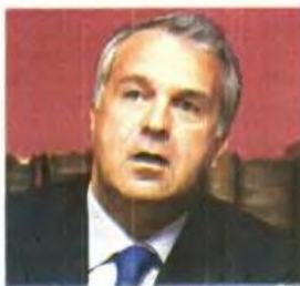
Τα οικονομικά δεδομένα πρόβαξε κυρίως ο υπουργός

Σύμφωνα με πληροφορίες, η συζήτηση, στην οποία τέθηκαν τρέχοντα θέματα που απασχολούν το υπουργείο Υγείας και κυρίως το ζήτημα του πλυσφόν που παραμένει εκκρεμές στο ΣτΕ, κινήθηκε από την πλευρά του υπουργού κυρίως από οι-